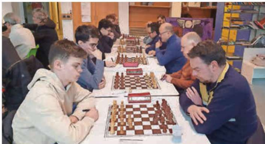
La prima squadra dl Gherdëina (a man drëta) à jugà contra la squadra jëuna de Bulsan Arci 2.

Per la lia dal Scioh Gherdëina, Ruben Bernardi