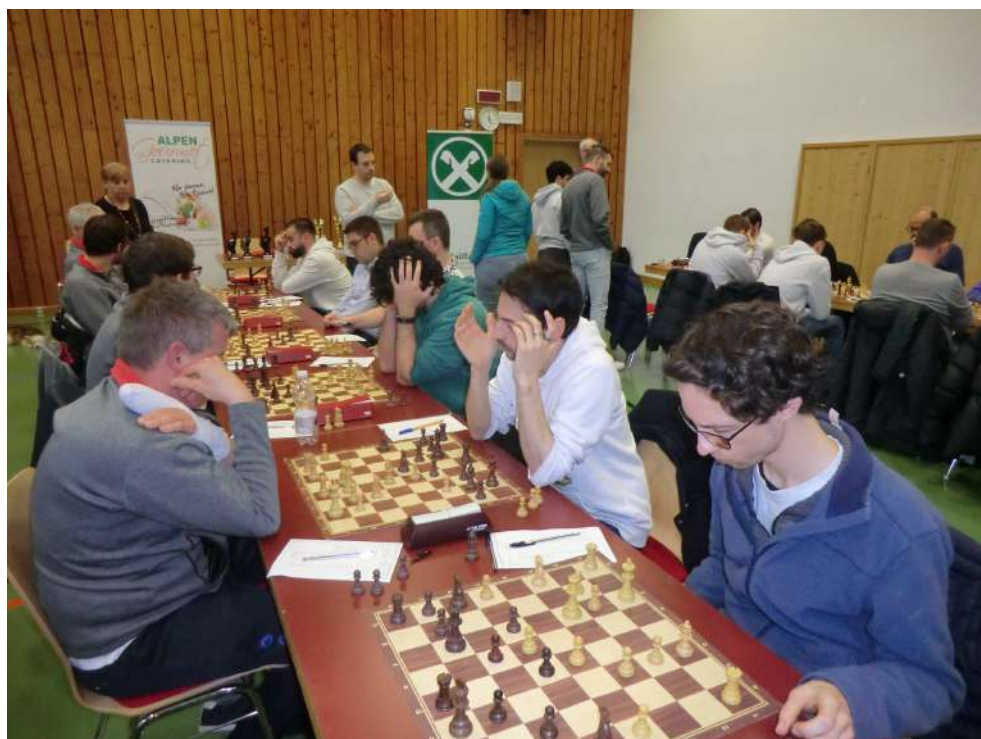
Dieses Treffen wird es in der 58. SMM wohl nicht mehr geben. Der neue Meister Deutschnofen rechts spielte in der 55. SMM am letzten Spieltag in Deutschnofen gegen den heurigen Absteiger Steinegg.

Treffpunkt ist jedenfalls der kommende Samstag 7. März im Deutschnofner Kulturhaus „Nova Teitonica“ um 15 Uhr. Alle Antworten auf die noch offenen Fragen werden wohl gegen 20 Uhr beantwortet sein, wenn auch die letzten Spielformulare mit den eingetragenen Ergebnissen unterzeichnet sind