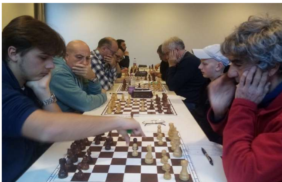
A sinistra il Gardena, a destra i nostri.