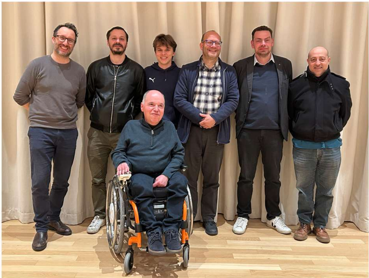
Gröden 1 muss sich mit Platz 4 begnügen