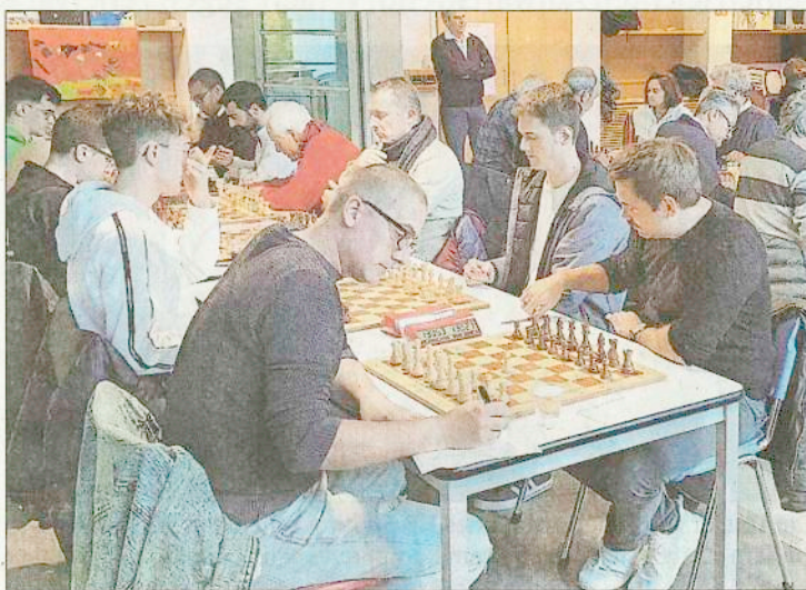
Ein klubinternes Duell gab es zum Saisonauftakt in der A-Klasse in Bozen, wo ARCI Scacchi I (rechts) auf ARCI Scacchi II (links) traf.

Gleich drei Begegnungen endeten 4:2. So sicherte sich Titelanwärter Deutschnofen auf Kosten von Brixen Milland die ersten zwei Punkte, genauso wie Titelverteidiger Gröden in Klau-