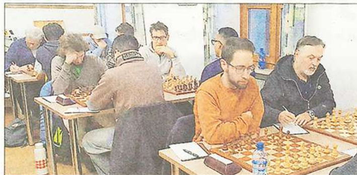
Abstiegssorgen plagen derzeit den fünffachen Meister Kaltern Tramin, im Bild die Spieler bei der letzten SMM-Begegnung am letzten Samstag.